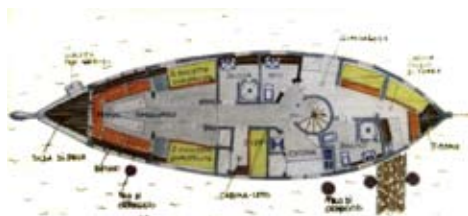
Sopra: Pianta della cabina.