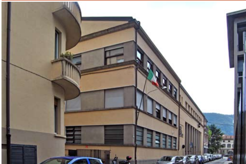
In basso: Veduta recente della facciata principale su via dei Partigiani.

1900-10 1910-20 1920-30 1930-40 1940-50 1950-60 1960-70 1970-80 1980-90 1990-2000