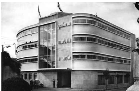
Sopra: Veduta d'epoca della Galleria appena inaugurata.

L'edificio, dal volume fortemente espressivo, supera le regole del Razionalismo locale, per recuperare suggestioni dall'architettura moderna nord-europea.